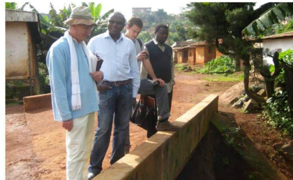
Entre 2007 et 2015, Élans a porté un programme d'actions en faveur de la santé, la culture, l'éducation et l'organisation des mairies financé par le Département.