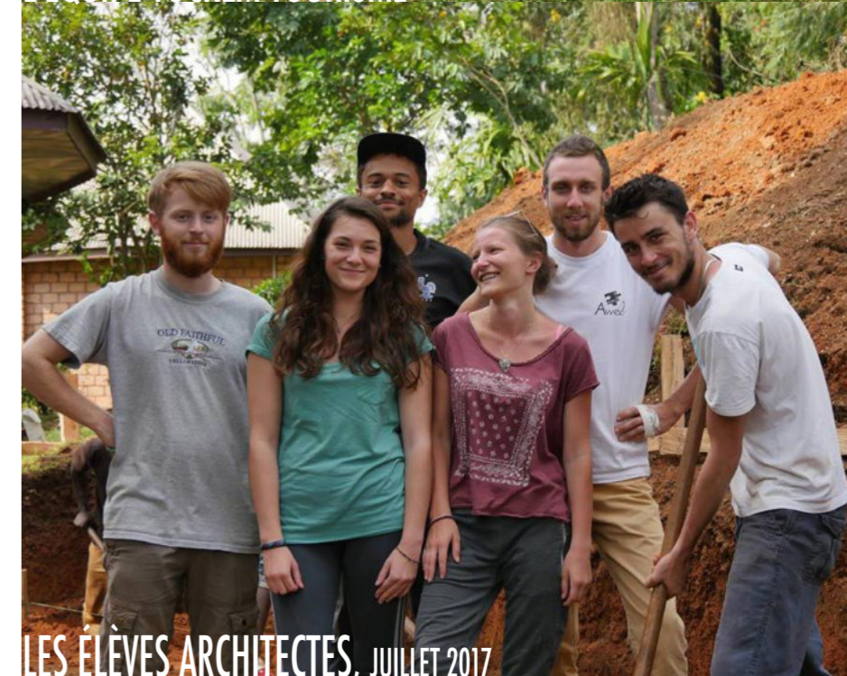
LES ÉLÈVES ARCHITECTES, JUILLET 2017