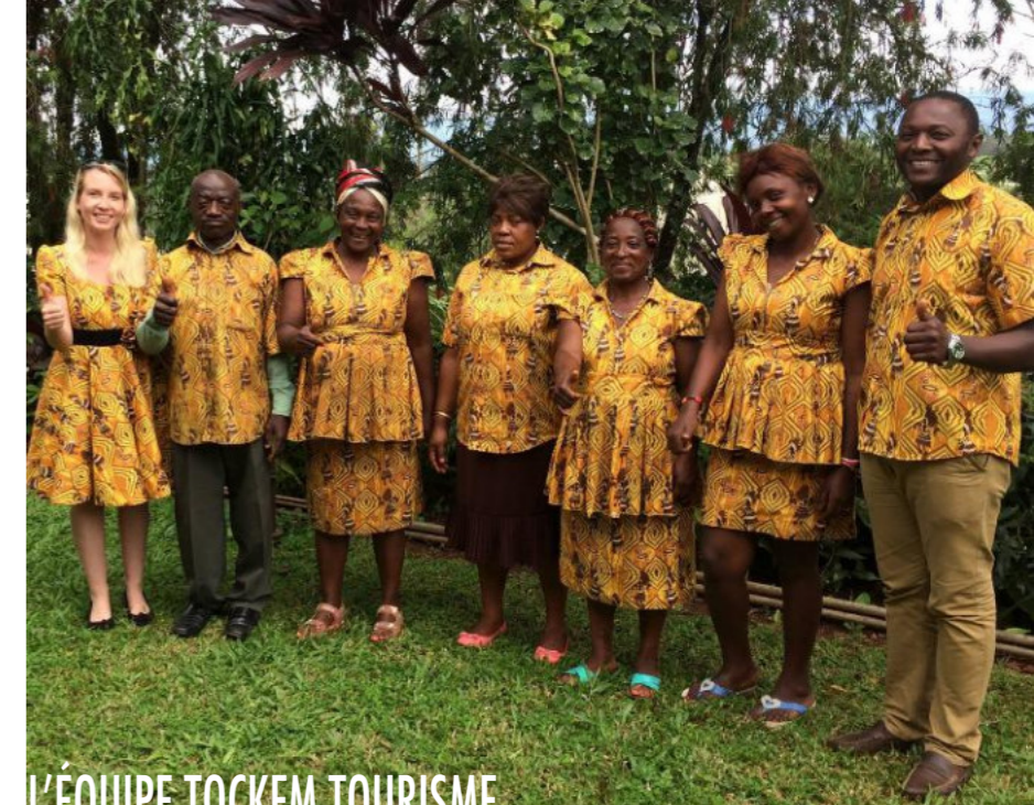
LES ÉQUIPE TOCKEM TOURISME

◇ Réalisation de 2 vidéos présentant TOCKEM tourisme, diffusées sur les réseaux sociaux.