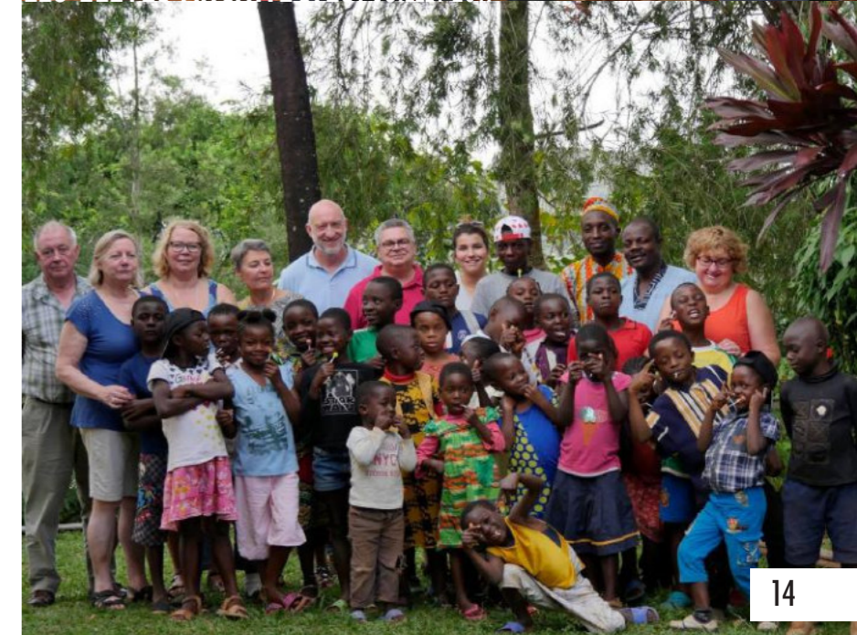
LES PARRAINS, NOVEMBRE 2017