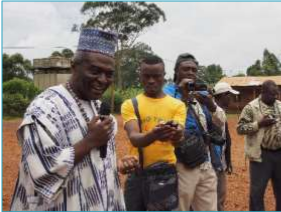
Interventions des présidents des associations ELANS et TOCKEM lors de la cérémonie officielle de lancement du projet SCAN Water de Folewi / Baletet