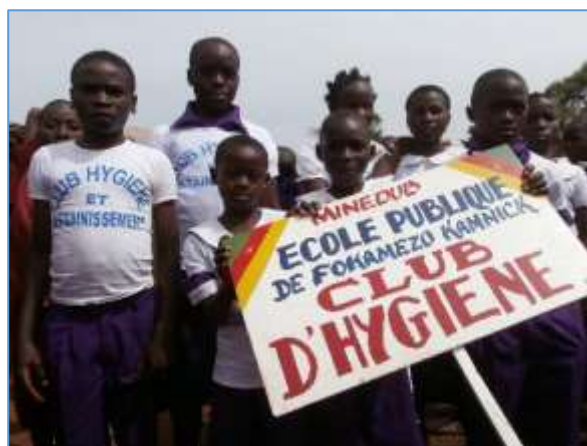
Club Hygiène et Assainissement des EP de Doumbou et de Fokamezo Kamnick lors des défilés du 11 Février (fête de la jeunesse) et du 20 Mai (fête nationale) à Nkong-Zem