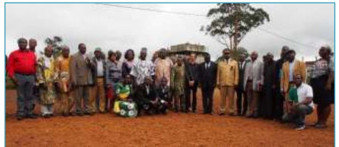
Acteurs participant à la mise en place du projet d'amélioration des conditions d'accès à l'eau potable des villages Folewi et Baletet