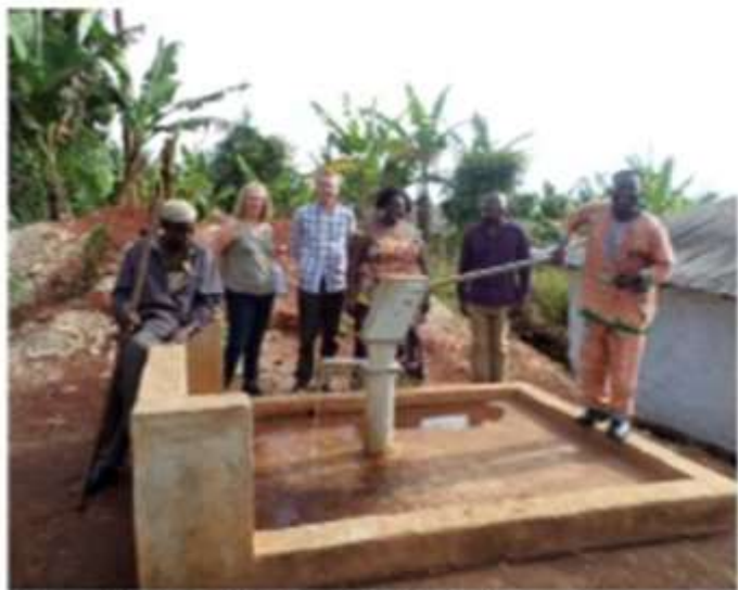
Des bornes-fontaines ont été installées pour l'eau potable.