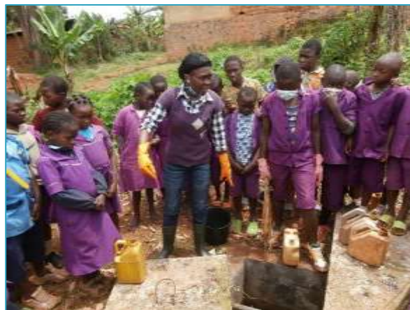
Elèves de Ndossah Groupe 2 en tenue de nettoyage / Rappels de l'animatrice de TOCKEM sur les consignes d'hygiène à tenir

Ainsi, plus de 4 000 élèves de 15 établissements primaires ont été sensibilisés à l'hygiène et des clubs de gestion des latrines ont été mis en place dans les établissements concernés. Les directeurs et enseignants ont été sensibilisés et formés pour encadrer les élèves dans la bonne gestion des latrines.