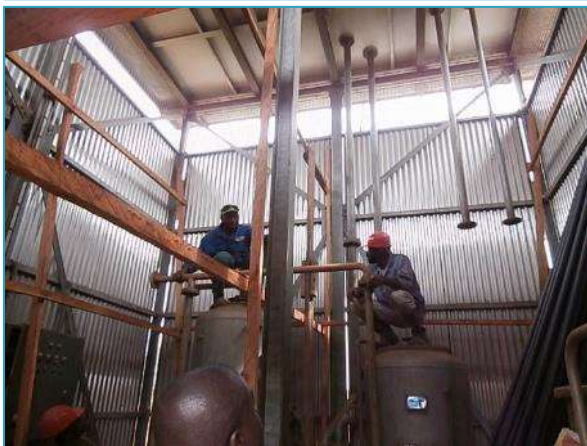
Le réservoir d'eau potable de Folewi / Intérieur de la station SCAN Water en cours de réhabilitation